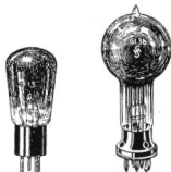
Gleichrichterröhre Typ Gl. 1.5.

Unsere neuen Gleichrichterröhren sind wegen ihrer bei niedriger Temperatur arbeitenden Kathode, ihrem kleinen Heizstrom, geringen Spannungsabfall, ungewöhnlich hohen Wirkungsgrad und ihrer langen Lebensdauer zu empfehlen. Alle Röhren werden mit zwei Anoden ausgeführt, nützen also beide Halbwellen aus und können ohne weiteres an Stelle von Oxydathodenröhren gleicher Leistung verwendet werden. Ein Umbau der betreffenden Geräte ist nicht erforderlich.